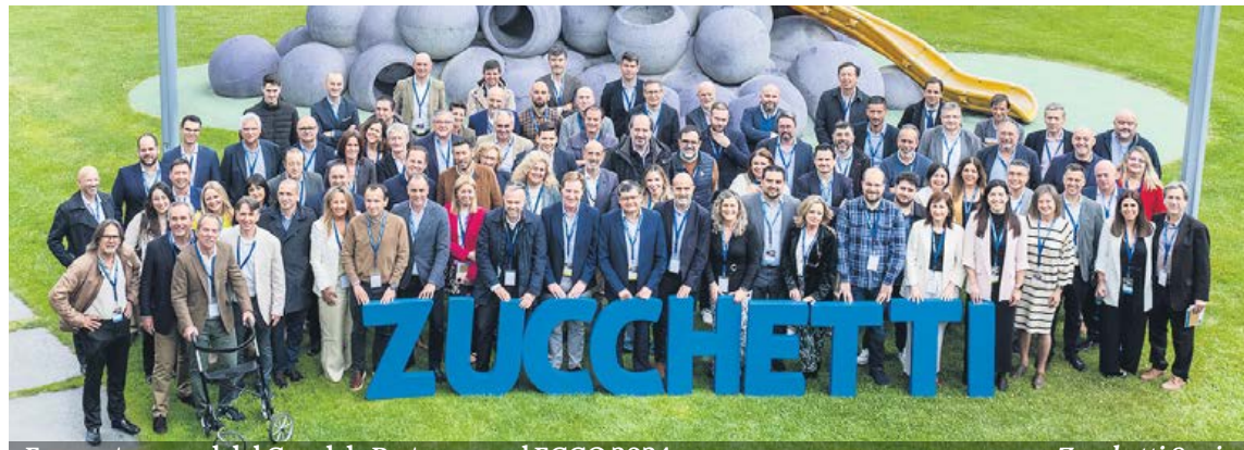
Encuentro anual del Canal de Partners en el ECCO 2024.